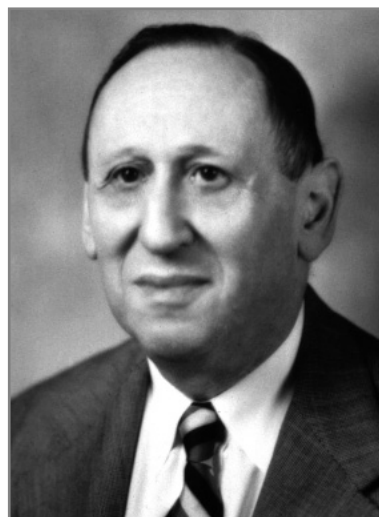
Leo Kanner (13 iunie 1894 – 4 april 1981)

nevăzători, deficienți motor, orfani, etc.. Preocupările și studiile în aceste domenii au devenit tot mai realiste în secolele XVIII și XIX.